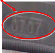
شکل ۱: تاریخ تولید حک شده بر روی تایر