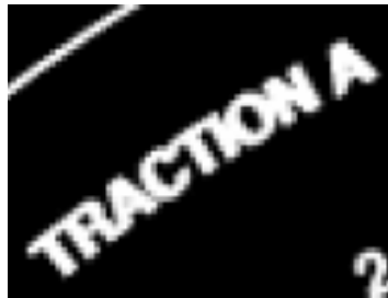
شکل ۵: نحوه نمایش کشش تایر بر روی آن