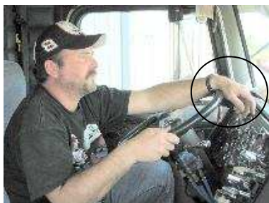
شکل ۸: استراحت مچ دست بر روی فرمان