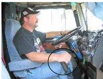
شکل ۹: قرار دادن کف دست بر روی دستگیره دنده